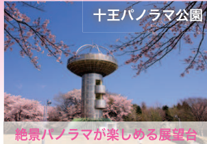
十王パノラマ公園